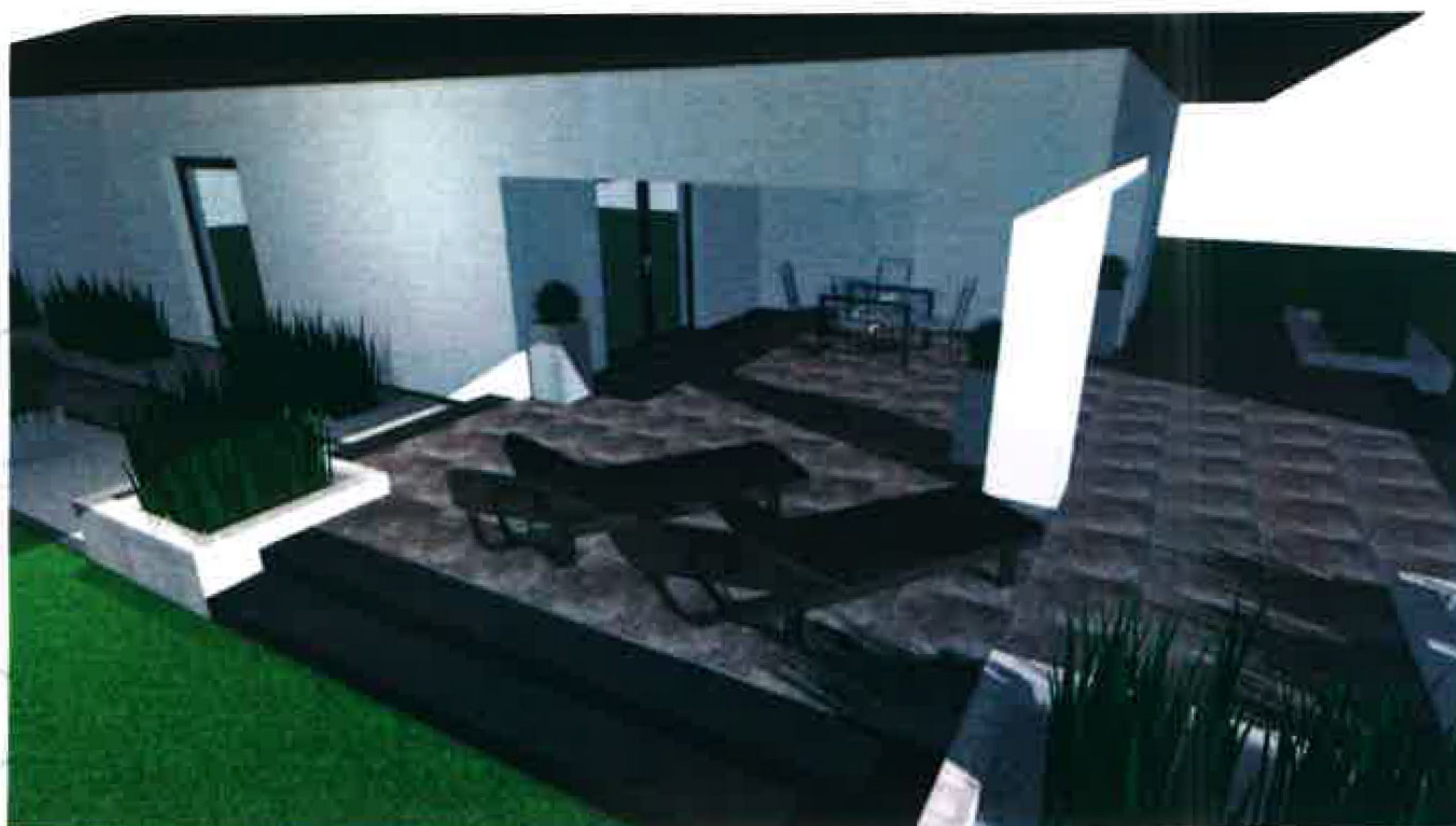
PRZYKŁADOWA WIZUALIZACJA FRAGMENTU INWESTYCJI